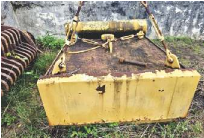
02 SEPARADOR MAGNÉTICO ELETRÓIMÃ ITALINDUSTRIA 8.000 W