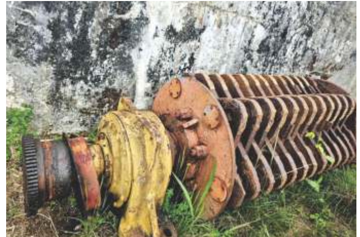
03 DESFIBRADOR DE CANA COP-5 COM MARTELOS E EIXO SAE 4340