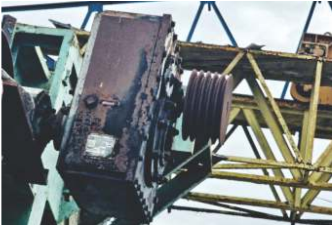
09 REDUTOR EIXO VAZADO FALK 3415 JR-25 (40 CV - 1:25,45)