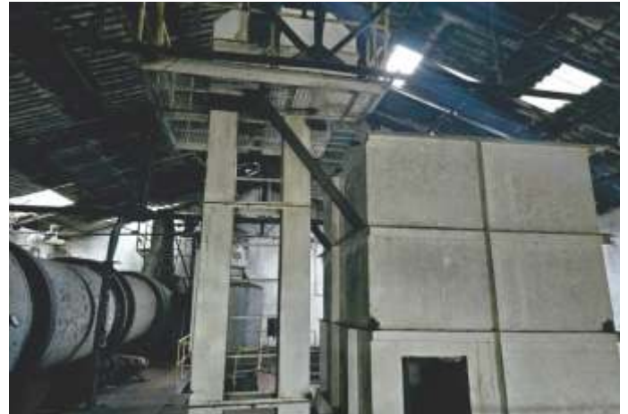
20 ELEVADOR DE CANECA P/ AÇÚCAR - ALTURA 10 M - CANECA INOX