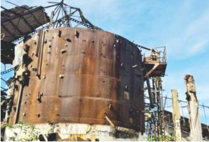
17 DECANTADOR DE CALDO AÇO CARBONO 300 M 3 - 4 BANDEJAS