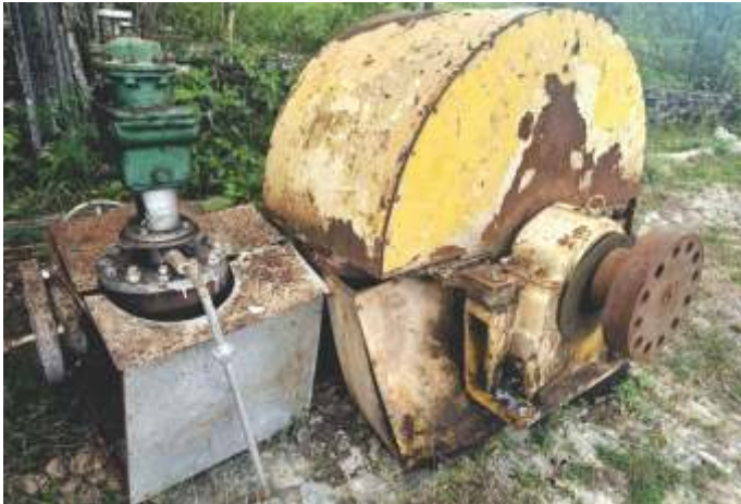
01 TURBINA A VAPOR DEDINI 1.917 CV - 1987