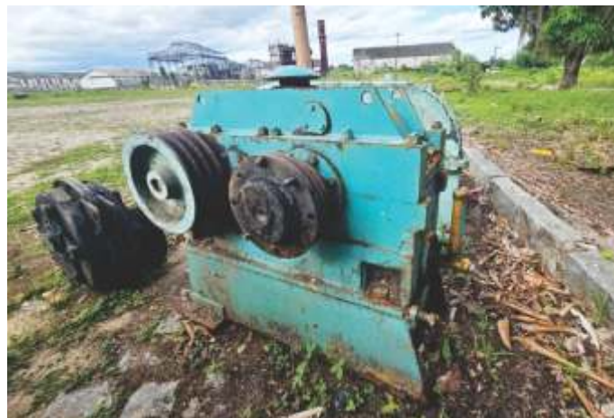
07 REDUTOR DE VELOCIDADE DEDINI M2A-200 (25 HP - 1:16,35)