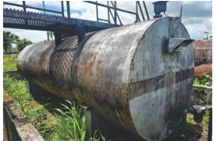
24 TANQUE DE COMBUSTÍVEL 15.000 L - HORIZONTAL AÇO CARBONO