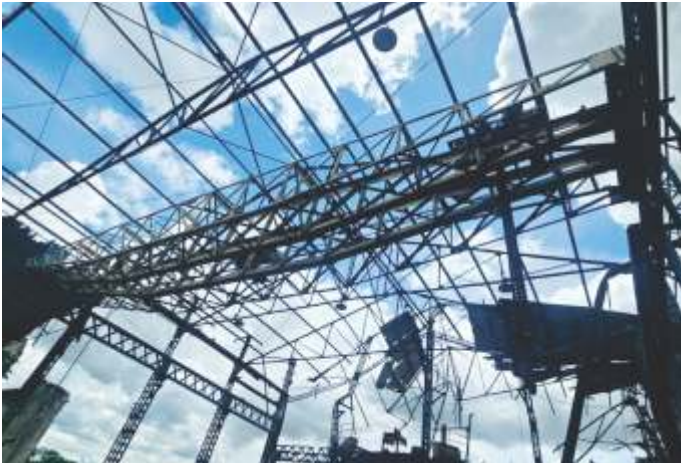
18 PONTE ROLANTE TRELIÇADA 18 TON - VÃO 19 M