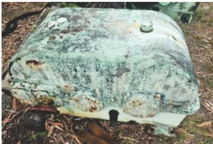
05 REDUTOR DE ESTEIRA METÁLICA MAUSA N-656 (1:45)