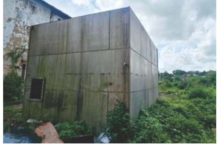
19 TANQUE INOX AISI 304 - 3.600 X 3.160 X 5.000 MM