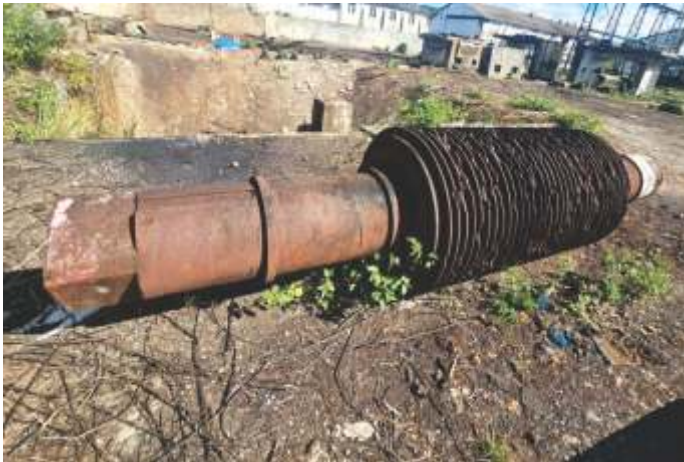
10 TAMBOR DE MOENDA 38"X72" - 12 TON AÇO SAE 1045