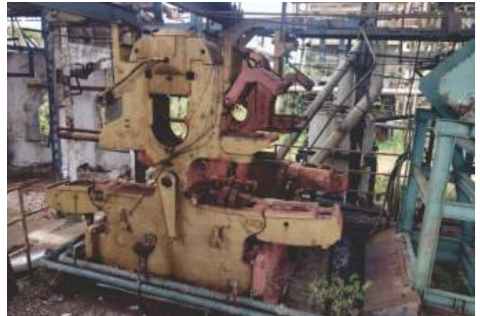
12 TERNO DE MOENDA COSINOR 30"X54" COM REDUTORES E ESTEIRA