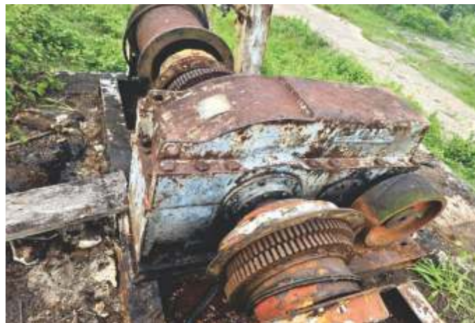
08 REDUTOR DE VELOCIDADE FALK 2090Y3- K-129 (1:129,9)