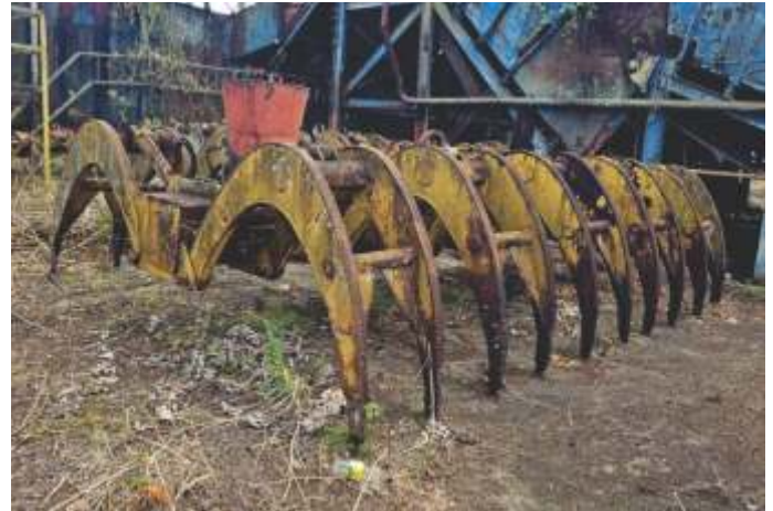
11 GARRA HIDRÁULICA SANTAL GPS-9.000 (9 TON)