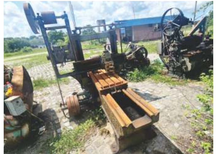
25 LOTE MÁQUINAS OFICINAS: TORNO, FURADEIRA, PRENSA, ETC.