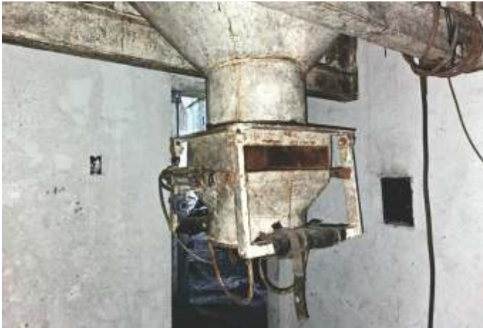
21 ENSACADEIRA DUPLA ELETRÔNICA TOLEDO P/ SACO 50 KG