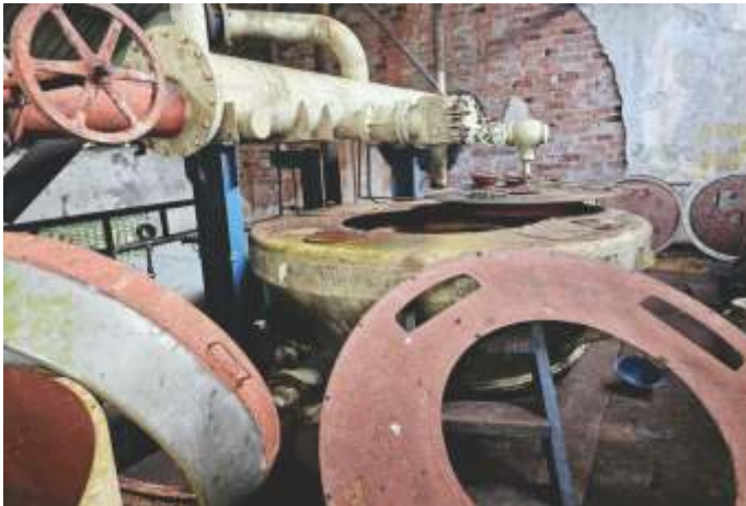
14 LOTE 4 CENTRÍFUGAS DE MASSA 3º - FIVES-LILLE E MAUSA