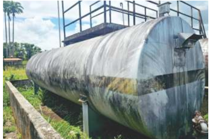
23 TANQUE DE COMBUSTÍVEL 20.000 L - HORIZONTAL AÇO CARBONO