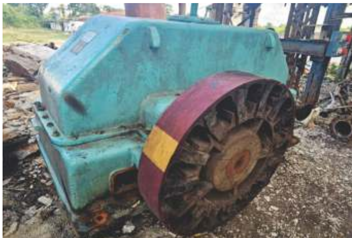
06 Redutor de Moenda Dedini 38x72" 1.100 HP (1:22.153)