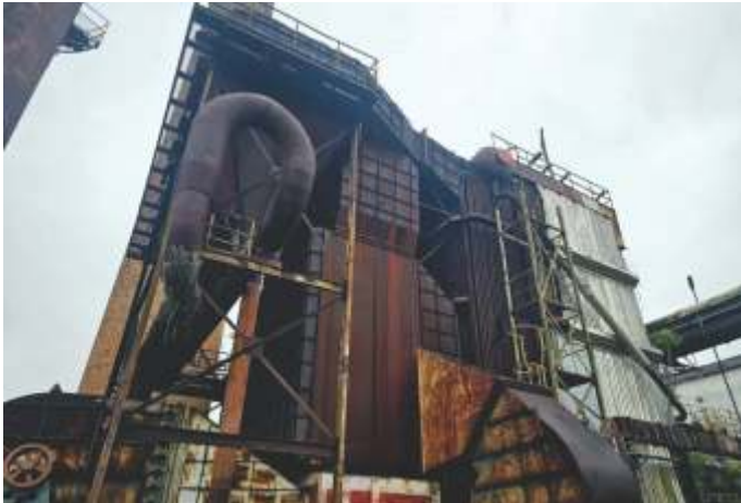
13 CALDEIRA DEDINI BMP 2.100 - 4T 80.000 KG/H - 1985