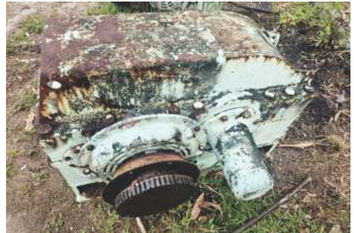
04 REDUTOR DE VELOCIDADE FALK 600 CV PARA PICADOR/DESFIBRADOR