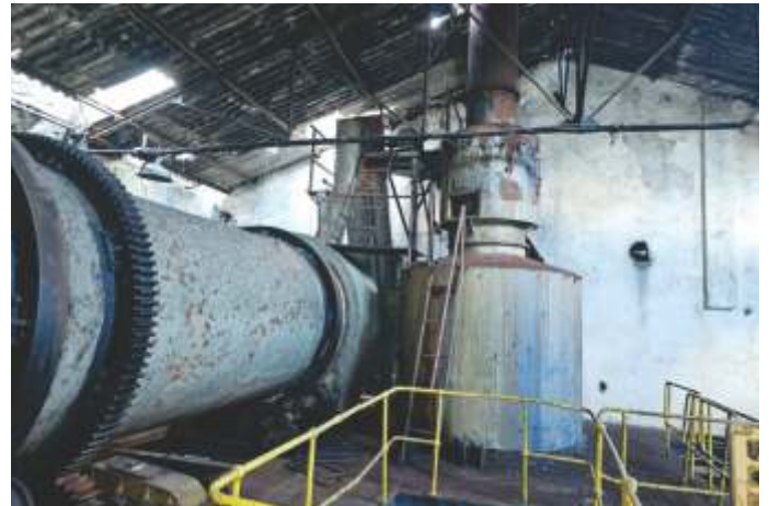
16 SECADOR ROTATIVO DEDINI P/ AÇÚCAR - 10.000 SACOS/DIA