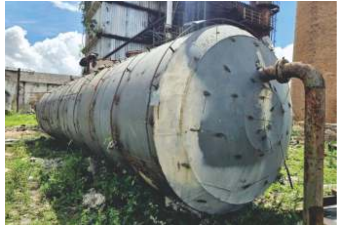
15 DESAERADOR AÇO CARBONO 57 M 3 (Ø 2.700 MM X 10 M)