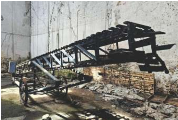
22 EMPILHADEIRA DE SACOS COM RASTELO - ELEVAÇÃO 8 M